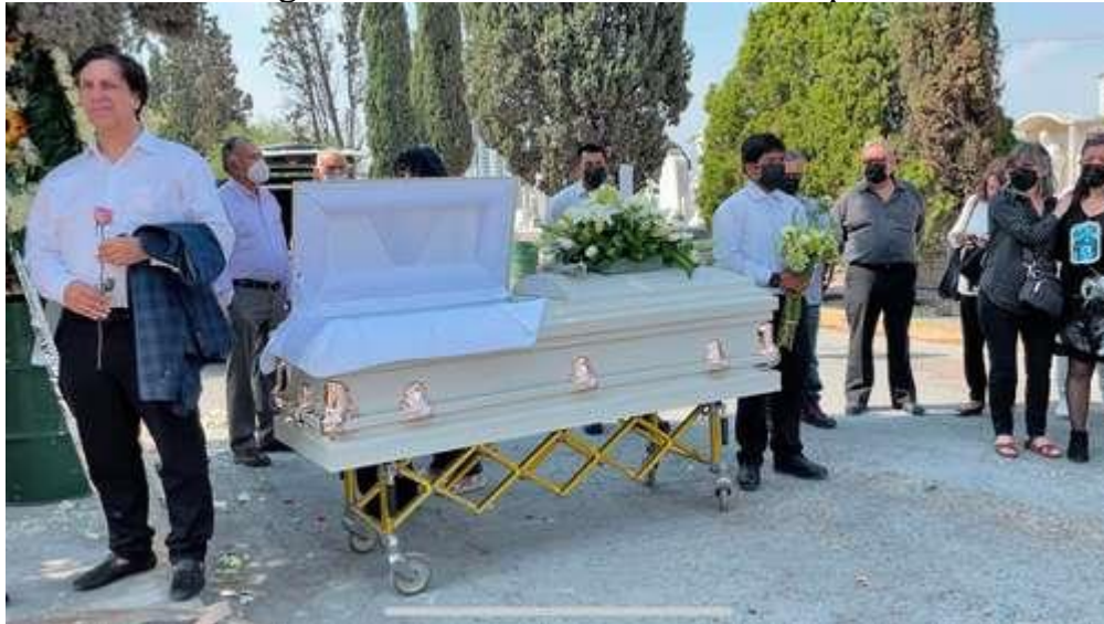
▲ Fue nuestra abuela, maestra y compañera, coincidieron en la despedida de la luchadora y activista.

Acusan al actual gobierno de no hacer lo suficiente para esclarecer los casos de desapariciones