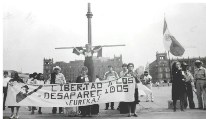
Protesta con crucifixión y mitin de familiares de desaparecidos.