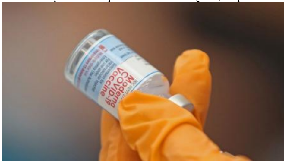
Una dosis de la vacuna de Moderna contra la COVID-19

Han sido 24 meses muy complicados para el sector salud. La ciencia hizo su trabajo y apagó la pandemia con vacunas desarrolladas en tiempo récord y los gobiernos hicieron el suyo montando, lo más rápido posible, campañas de vacunación masivas y gratuitas. Sin embargo, no olvidemos nunca la respuesta de los trabajadores de la salud durante el primer año de pandemia, en que miles arriesgaron su vida y algunos la perdieron, en pro de la salud de sus compatriotas.